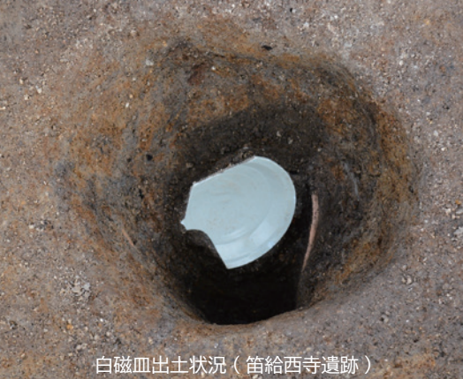
白磁皿出土状況（笛給西寺遺跡）