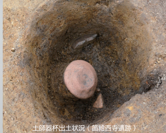
土師器杯出土状況（笛給西寺遺跡）