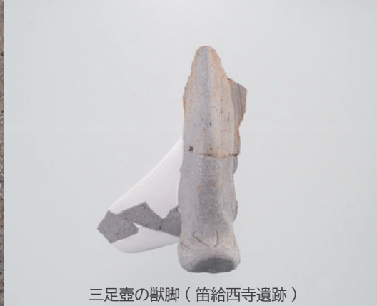
三足壺の獣脚（笛給西寺遺跡）