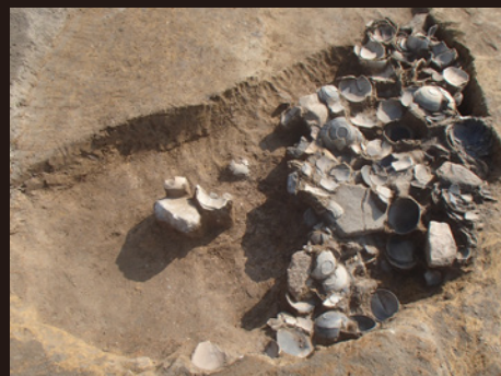
【写真】遺構から見つかった大量の中世の瓦器塚（赤頭遺跡）