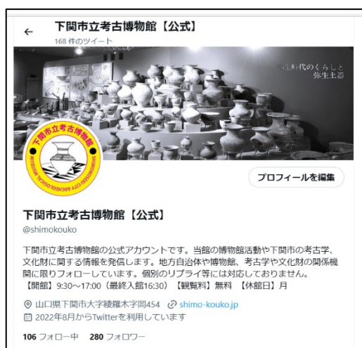
▲公式 X(旧 Twitter)