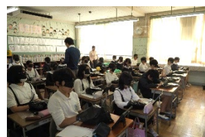
▲小学校での触察体験授業