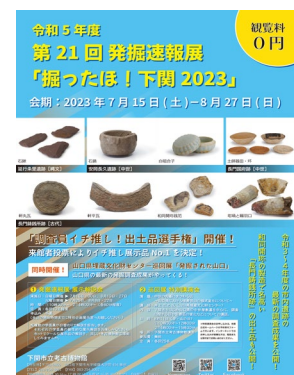
▲発掘速報展ポスター

(美祢市 於福金山遺跡、美祢市 道場・中村遺跡、柳井市 信川遺跡、田布施町 馬場遺跡)