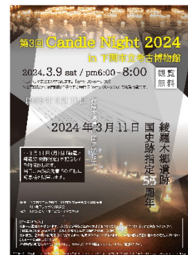
▲Candle Night 2024 チラシ