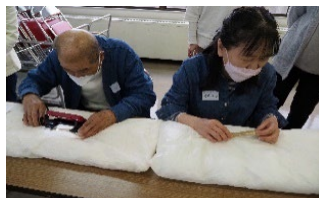
▲視覚障害者を対象にしたワークショップ