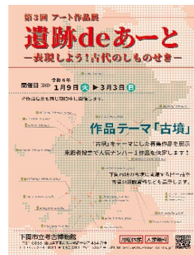
▲アート作品展ポスター

内容:「第3回やよい絵画展」(平成13年度開催)の優秀作品11点を展示し、来館者投票により人気作品を決定した。12月27日(水)公式HP・SNSで結果発表。