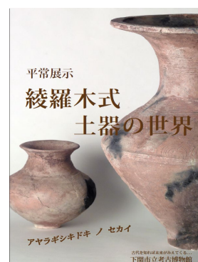
▲平常展示ポスター