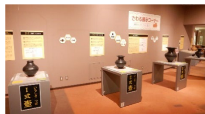
▲さわる展示コーナー

令和 4 年 4 月 29 日から常設展示の一部としてプレオープン。令和 5 年 1 月 5 日から本格的に公開・供用開始。