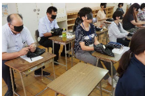
▲教員による触察研修