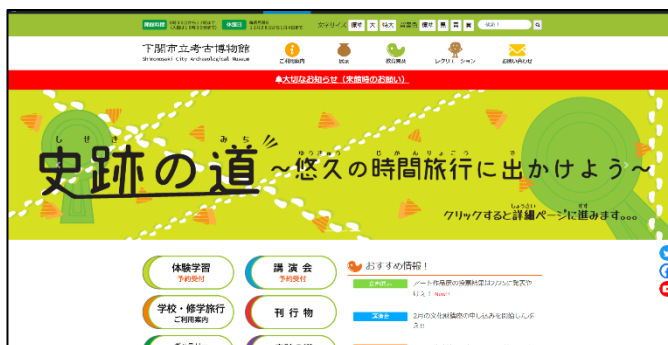
▲公式ホームページ