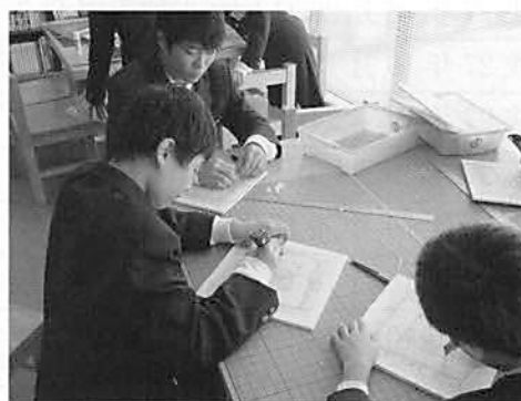
▲職場体験学習(教材づくり)