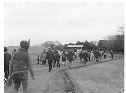
▲史跡の道ウォーク