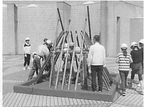
▲ 竪穴住居組み立て体験