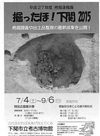
▲発掘速報展ポスター