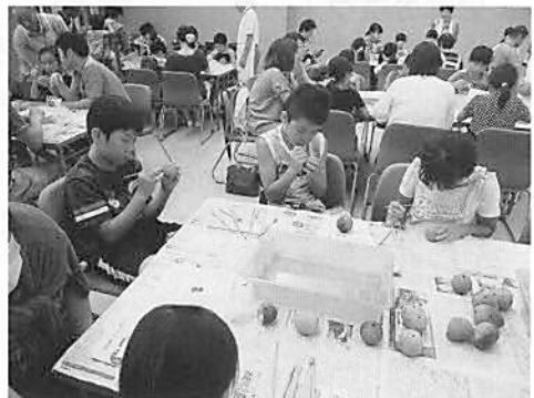
▲ 土笛・土鈴づくり教室