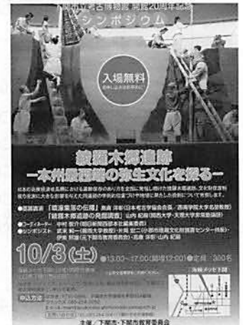
▲シンポジウムポスター

内 容 綾羅木郷遺跡は、1,000 基以上の貯蔵用竪穴が検出されたことで知られる弥生時代の集落関連遺跡で、考古博物館はそのサイトミュージアムとして建設された。考古博物館開館 20 周年を記念し、建設の経緯となった綾羅木郷遺跡について、文化財保護制度の充実に大きな影響を与えた同遺跡の学術的位置づけと地域に果たした役割について考察した。なお、会場では、下関市立考古博物館マスコット「ぶえ吉」着ぐるみの発表、新発見土笛のポスターセッション、開館以来の特別展・企画展のポスター展示、郷土の文化財を守る会の写真パネル展示を行った。