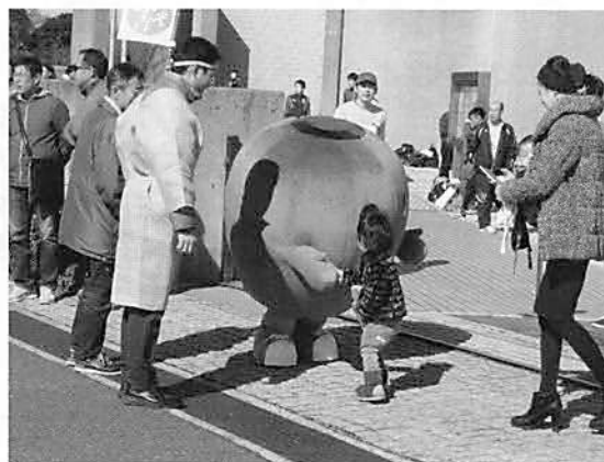
▲下関市駅伝競走大会