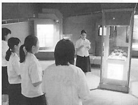
▲職場体験学習(展示解説)