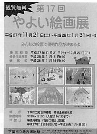
▲やよい絵画展ポスター