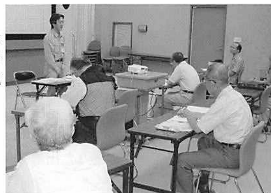
▲ミュージアム・セミナー