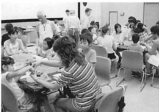
▲土笛・土鈴作り教室