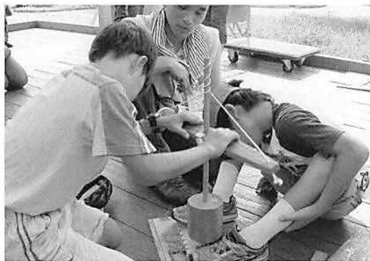
▲古代こども体験教室